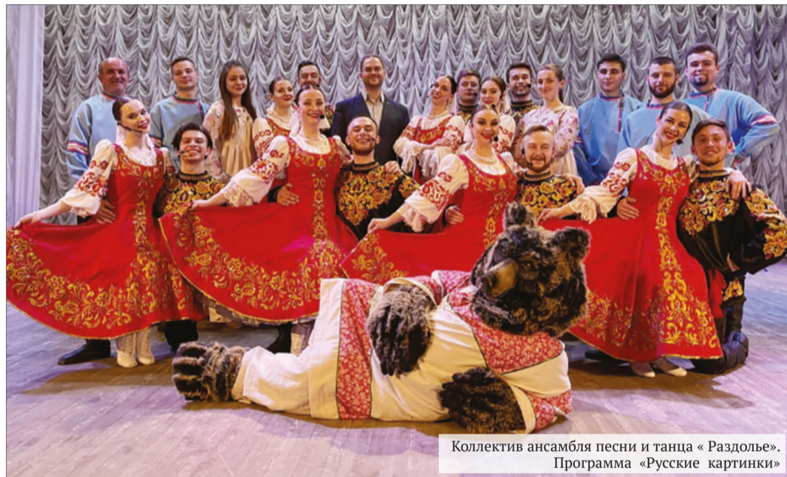
Коллектив ансамбля песни и танца «Раздолье». Программа «Русские картинки»