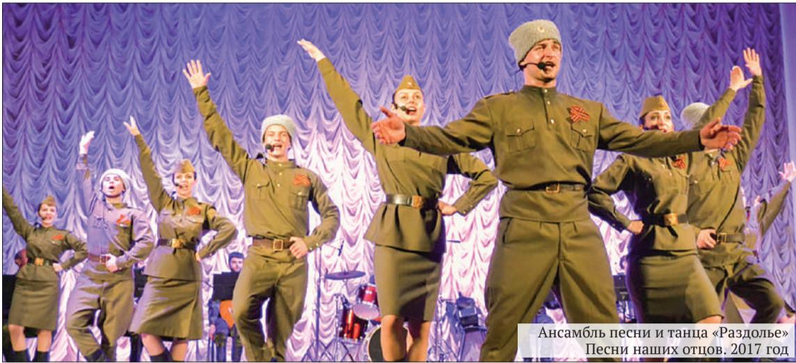
Ансамбль песни и танца «Раздолье» Песни наших отцов. 2017 год

Филармония – храм искусства, она же – лазарет для души и школа для неокрепших талантов. Луганская академическая филармония именно такая – многоликая, и я постараюсь познакомить вас с некоторыми её гранями.