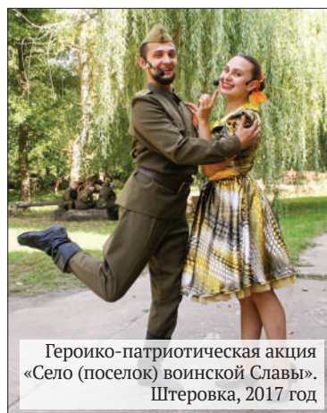
Героико-патриотическая акция «Село (поселок) воинской Славы». Штеровка, 2017 год